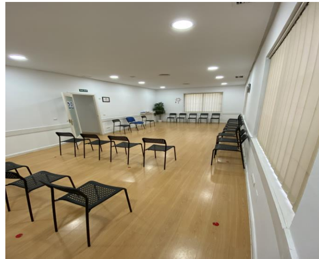
SALA DE TERAPIA 2