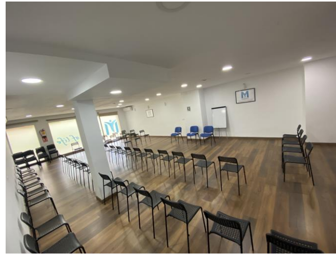
SALA DE TERAPIAS 1

CON UNA SUPERFICIE DE 600M 2 DECIDADO A TRATAR LAS ADICCIONES