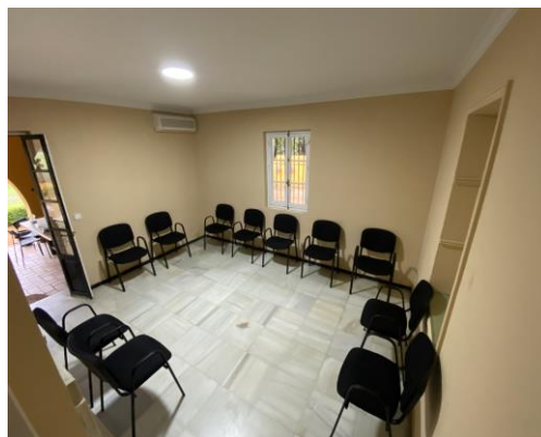
SALA DE TERAPIA